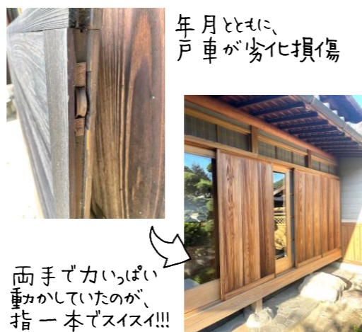
年月とともに、 戸車が劣化し損傷

木製の建具や雨戸を開け閉めする時、重かったり、力を込めないと動かないことはないでしょうか？「こんなもんやろ」で済まらず、一声かけてください。戸車を替えたり建具の調整をするなど、少し手を加えるだけで、また昔の様にストレスなく快適に使えるようになることがあります！