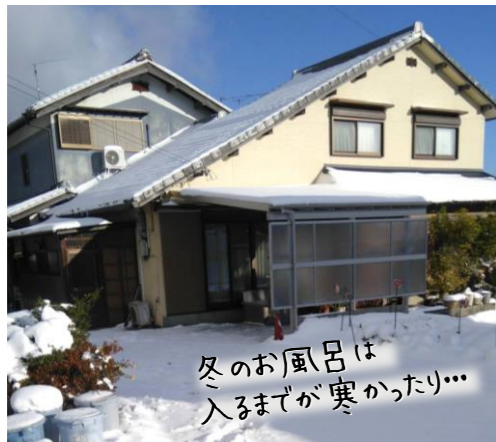
【ヒートショック、温度差による血圧変動に注意!】