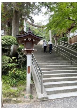
（撮影／記事担当 水落成典）

今回訪れたのは、桜井市にある、大神神社（おおみわじんじや）です。三輪山という山自体をお祀りする磐座祭祀が行われていたとされる、日本で最も古い神社の一つです。参拝することが山（自然）に対して手を合わせることに自然というところが好きで、氏神様ではありませんが、時々お参りにいきます。境内を散策していると空気が冷たくて、心がすごく落ち着くので自分のするべきことが見えてくる気がして、自然という偉大なものに感謝の気持ちになります。