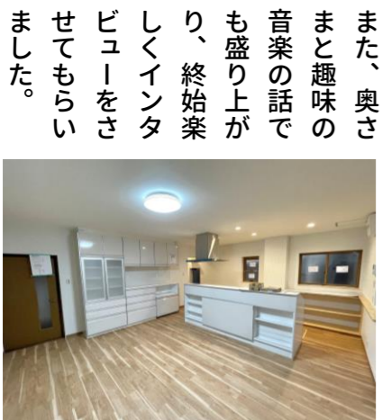
▲家族7人が集まりやすいLDK

七人の立場になって考えて提案（お父さんの居場所をつくったり）したし、なにより、老舗を受け継いでいる方のお仕事をさせてもらったことが大きいと話していました。