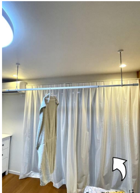
水落家で使用の商品「ホスクリーン」は、天井から吊り下げている棒を外せる（外観◎）。高さは3段階調整。耐荷重は、約15Kg。