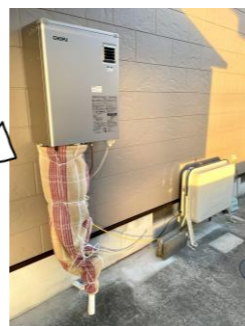
入れ替え後、配管をぐるぐる巻きに！積雪のある地域はぜひ、この予防策を！