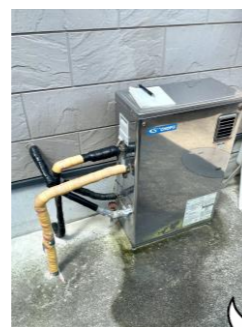
水が漏れだしている…！（地面のコンクリートが濡れている）

給湯器は、なかの銅管の青錆が原因で穴が開き、水圧で広がって水が漏れ出すことがあります。ですがその場合、部品がなく修理できないパターンが多いです。新しく入れ替えて、凍結で破裂して水が漏れないよう、配管を毛布で包んで故障を防ぎます。